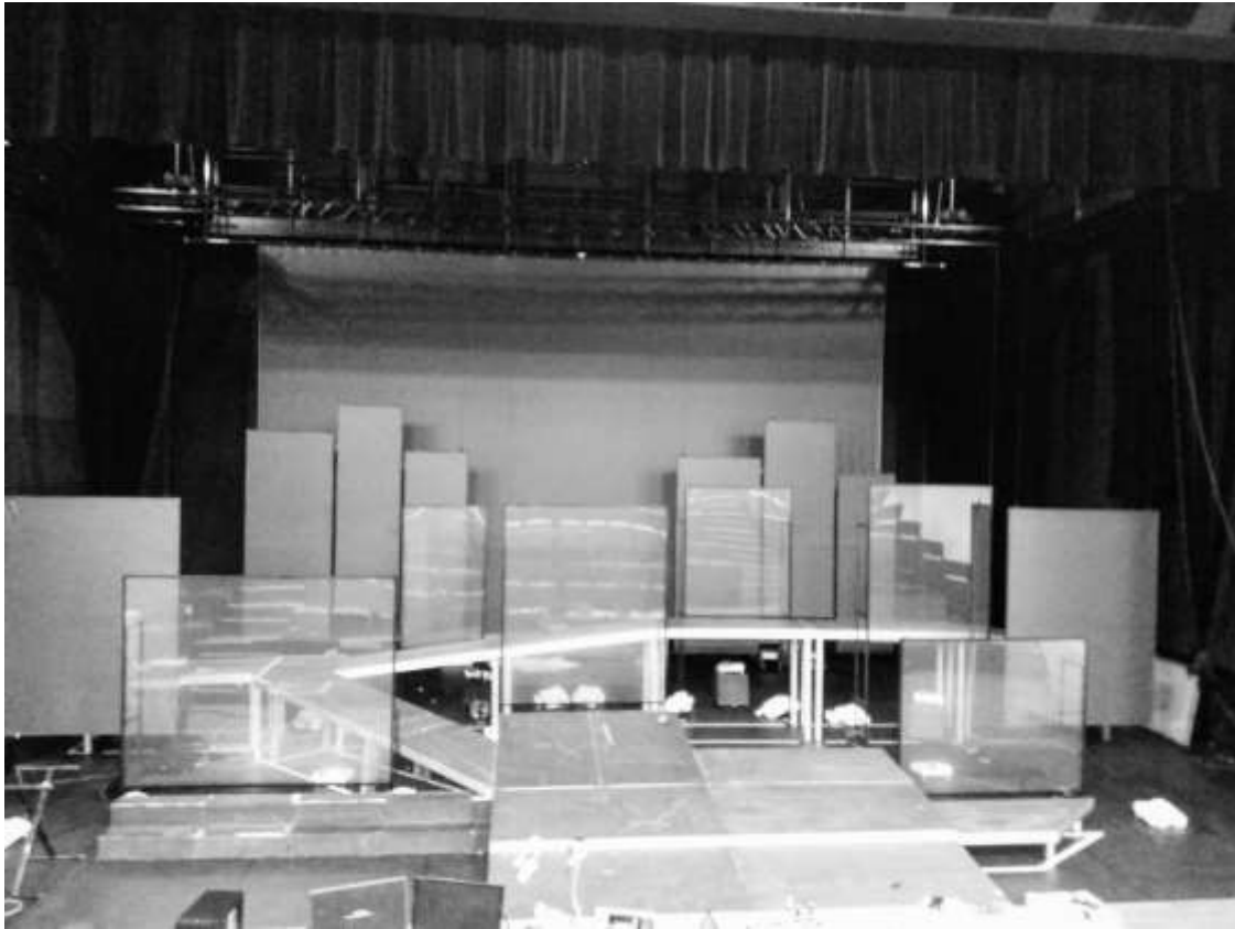
du décor lors d'un montage