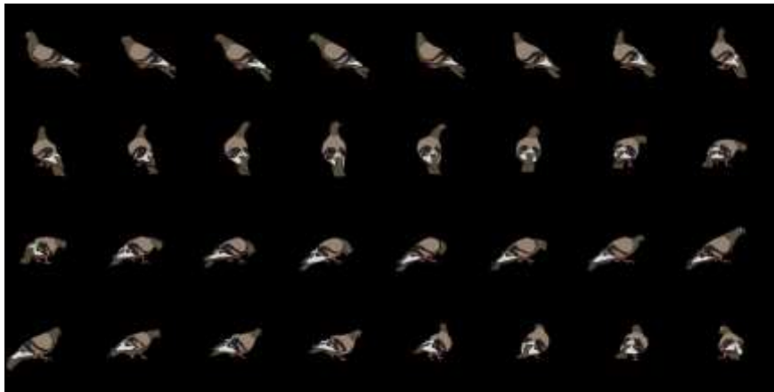
Travail de dessins réalisés pour l'animation du pigeon

Quelques scènes plus tard il disparaît du plateau pour apparaître en image dessin animé sur la façade d'un des immeubles.